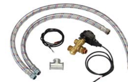
Kit collegamento caldaia/bollitore - KHG714096310

A Punti aggancio caldaia. Interasse punti aggancio caldaia: 425 mm B Distanza asse punti di aggancio/asse raccordi